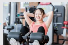
本格マシンで トレーニング