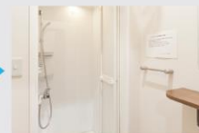
シャワー、お着替え